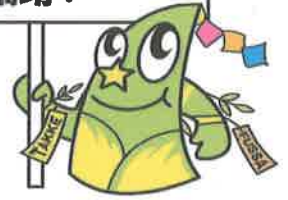
福生市公式キャラクター たっけー☆☆