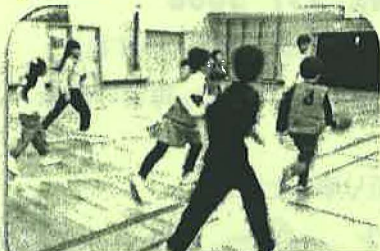
五小卒業生の地域サポーターさんの バスケット教室