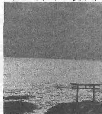
初日の出(大洗海岸にて)