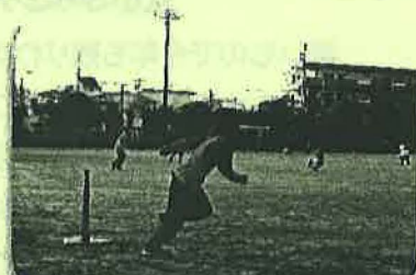
福生リトル・サンズさんの 野球教室