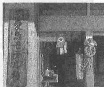
お正月しめ縄飾り (コミュニティ・スクール委員より)

保護者、地域の皆様には、様々な面で御協力をお願いするとは存じますが、どうぞよろしくお願いいたします。本年が皆様にとりまして良い年となりますよう、心よりお祈り申し上げます。